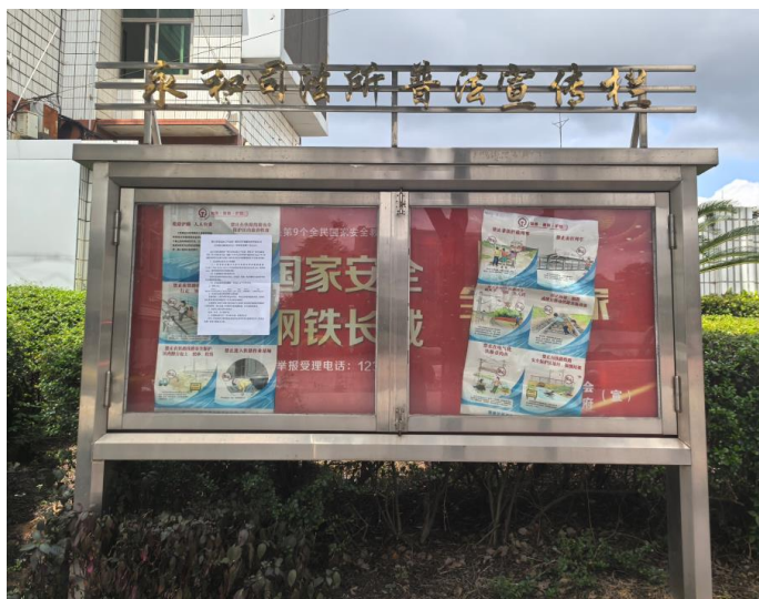
永和镇政府张贴照片