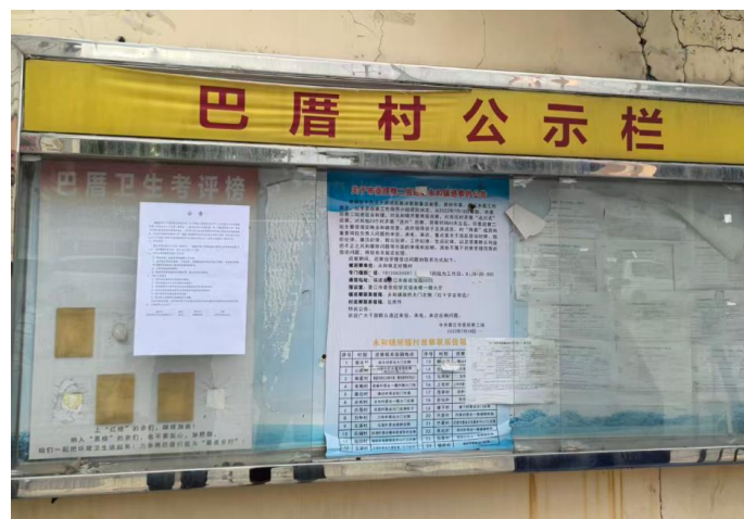
巴厝村村委会张贴照片