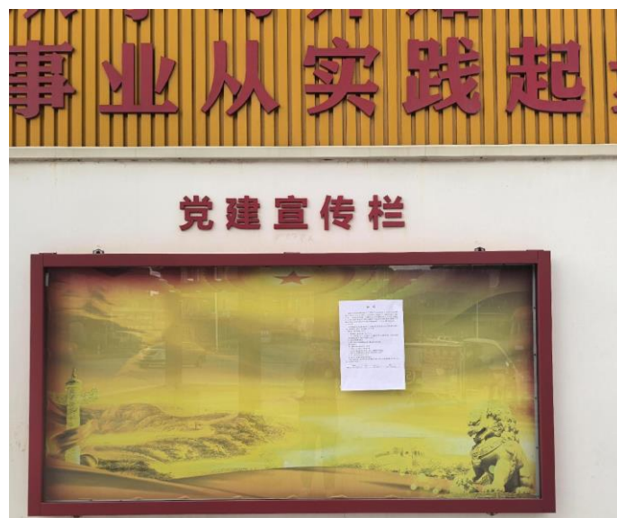
西坑村村委会张贴照片