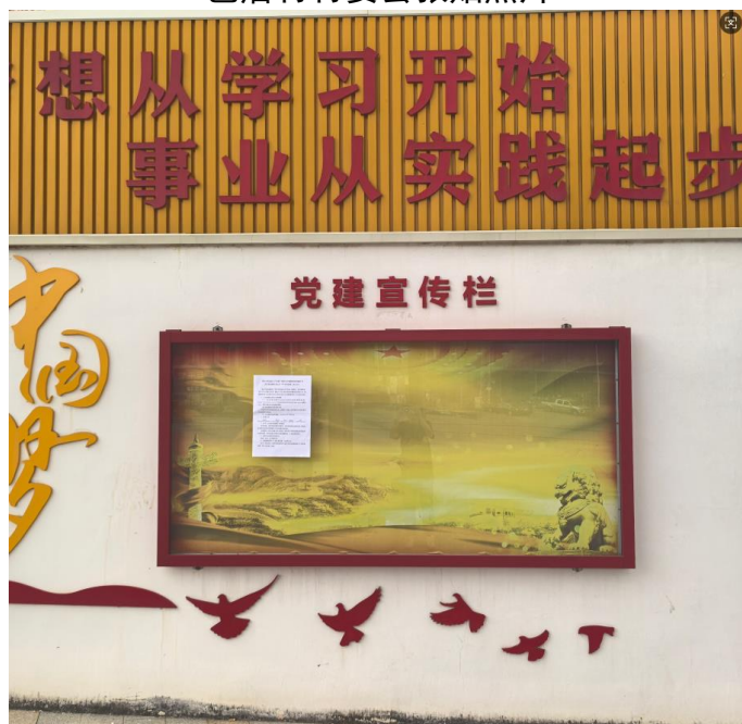
西坑村村委会张贴照片