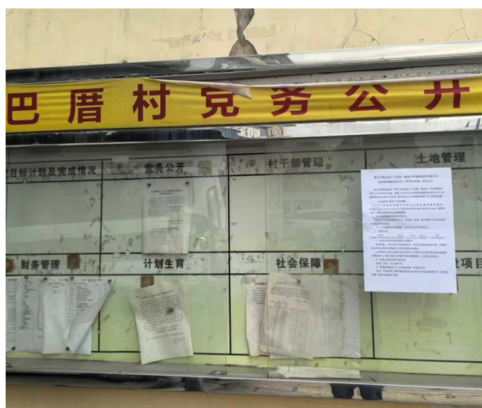
巴厝村村委会张贴照片

项目位于晋江市永和镇，其周边村庄主要为巴厝村和西坑村，永和镇政府、巴厝村和西坑村村委会项目所在地公众于知悉的场所，作为项目公示张贴场所，符合《环境影响评价公众参与办法》关于张贴场所的要求。