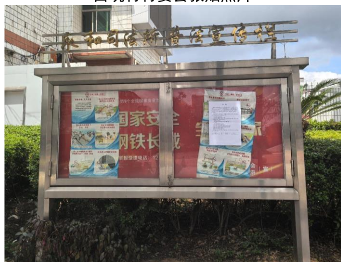
永和镇政府张贴照片