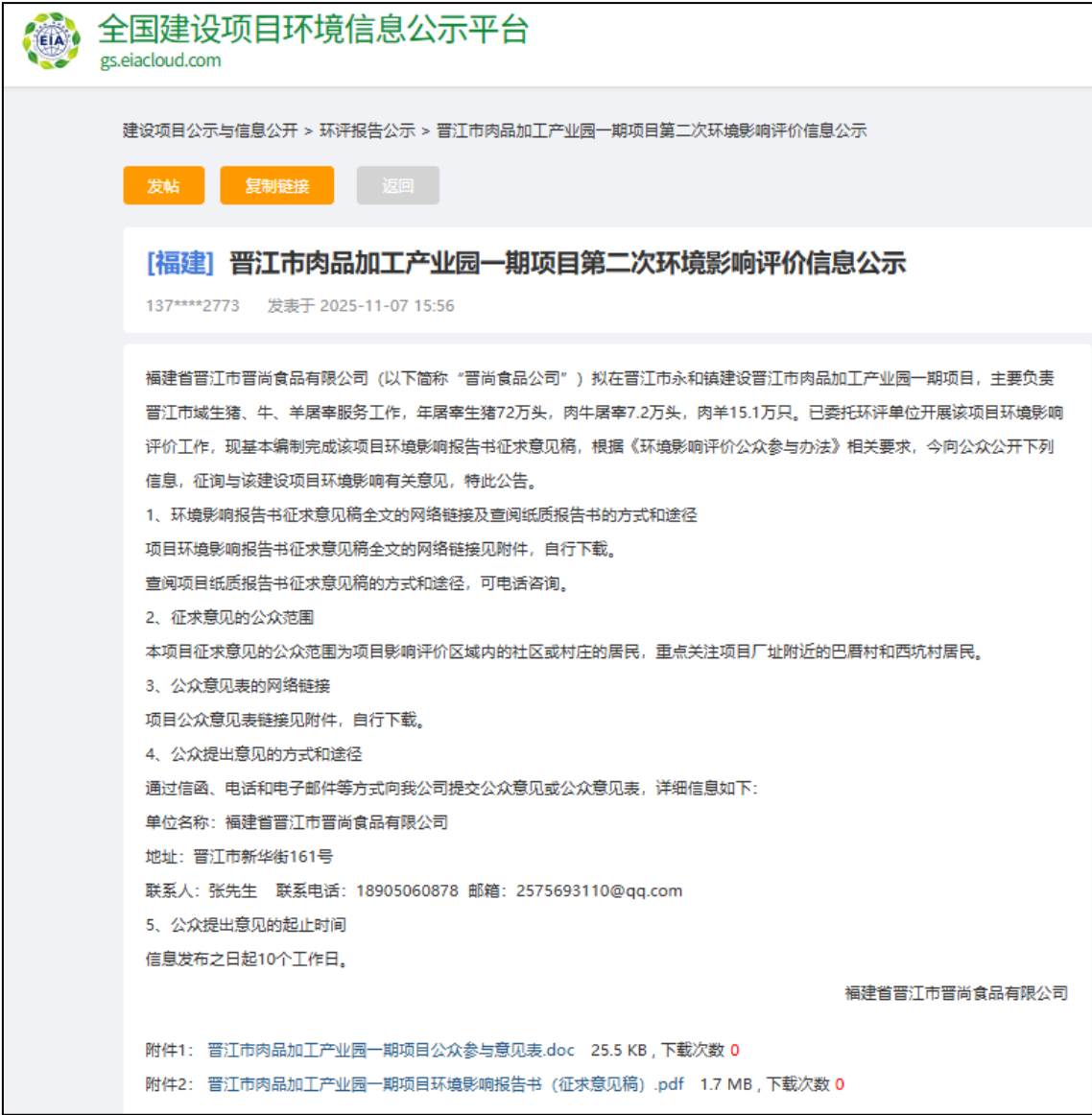
图3 项目第二次环境信息网络公示截图

全国建设项目环境信息公示平台是专业的环评信息公开服务平台，作为项目公示网络平台，符合《环境影响评价公众参与办法》关于网络公示媒介的要求。